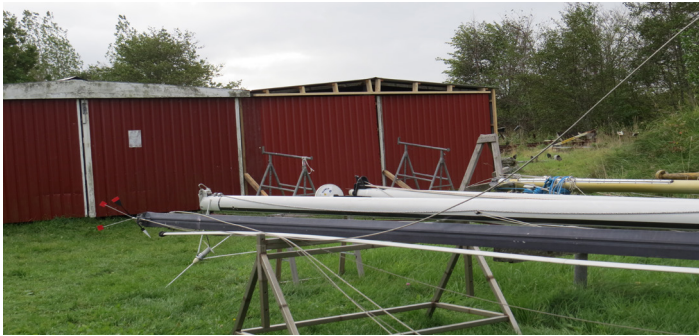
Nyt Mastehus ved at være klar