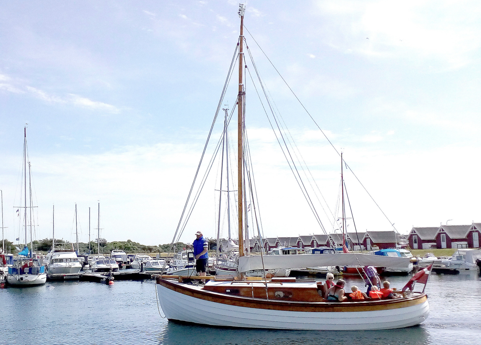
"Nordstjernen" på havnerundfart