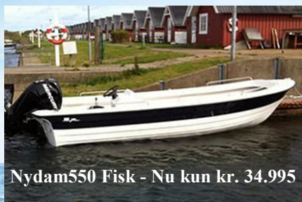
Nydam550 Fisk - Nu kun kr. 34.995

Kom til Frederikshavn og få den bedste pakkepris på din Nydam båd.