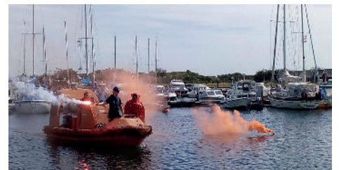
Demonstration af redning til søs.

100 havne over hele Danmark involveret i lignede arrangementer ... så rigtig mange frivillige i hele Danmark