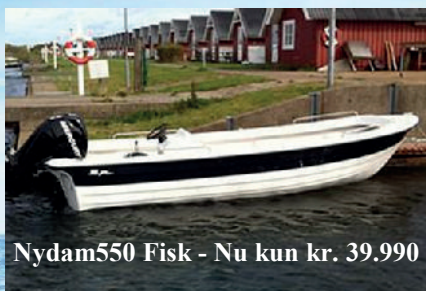
Nydam550 Fisk - Nu kun kr. 39.990