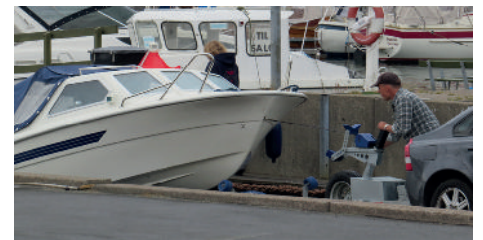
Så kom bådene på land igen

nende vejr med sig,- var der nyt uvejr på vej op ad østkysten. Stævnet blev aflyst af ledelsen. Det var en ærgerlig, men fornuftig afgørelse af hensyn til at de små både går langt ud for at fiske.