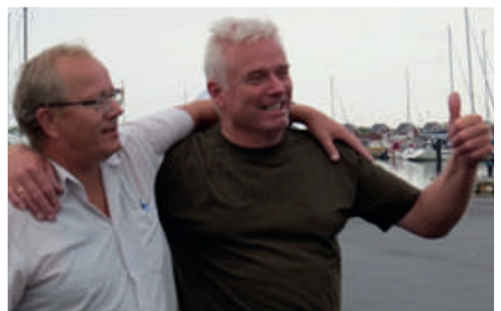
Kampgejsten lagede sig ikke