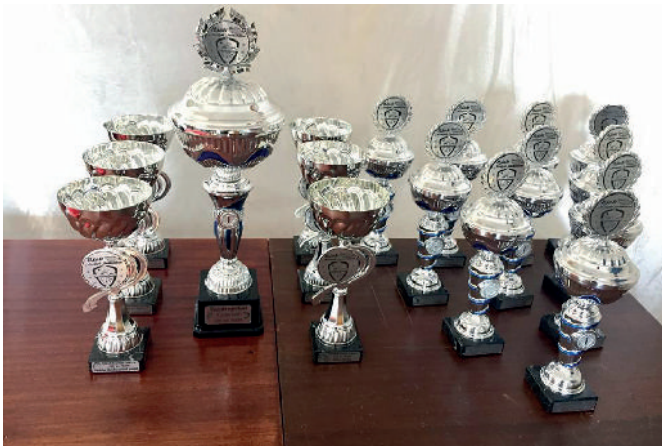
Præmierne blev pakket ned