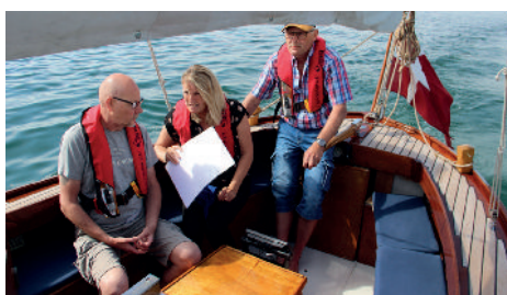
Borgmesteren og 2 x Henrik til søs

Den 9. juni havde Rønnerhavnen besøg af rigtig mange mennesker ... de kom for at deltage i det store Kræmmermarked samt at se og deltage i arrangementerne som var stablet på benene til Vild med Vand – Havnens dag. Denne dag blev en succes for alle aktørerne ... der blev handlet og kræmmeret ... der blev sejlet havnerundfart ... der blev reddet folk op fra havnen ... der blev fanget krabber ... der blev hoppet i det store piratskib af en hoppeborg ... der var aktiviteter overalt på havnen ... og det hele kunne ses 30 meter oppe, fra Brandvæsenets store stigevogn.