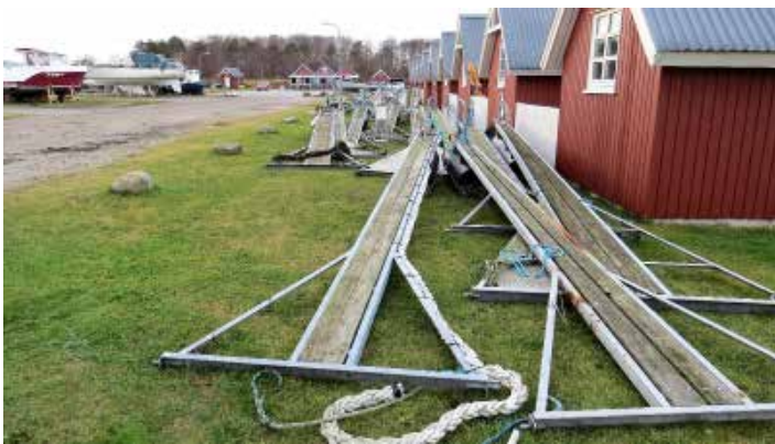
Omfattende renoveringer af broerne

Flise gangen ved kajen ud for Vinterbadernes huse renoveres og entreprenør er bestilt.