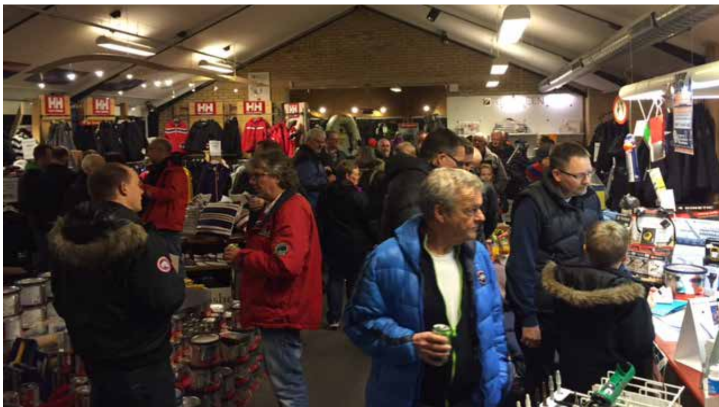
fra tidligere "sejleraften"

Vi byder på "lidt godt til ganen" under arrangementet.