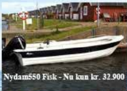
Nydam550 Fisk - Nu kun kr. 32.900

Kom til Frederikshavn – Vore 2016 modeller Bedste priser i Danmark – se dem på www.m-center.dk