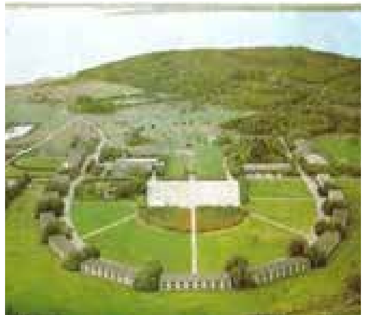
Auderødlejren med kompagnibygningerne

Auderød-Lejren var blevet lukket! Omkring 2008 var det kære skib dømt til ophugning, men gode kræfter i Frdrerikshavn der havde skibet kært, fik det opskåret i tre dele og på tre blokvogne bragt det til Bangsbo Fort i Frederikshavn, -hvor det "strandede" i bakkerne! Her blev det svejset sammen og det siges at skibet fik