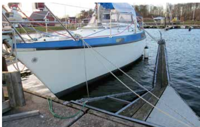
Ældre Y-bom kunne ikke klare trykket