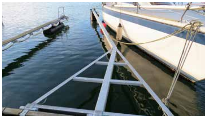
Ny Y-bom kunne ikke klare trykket

Vandstanden i Kattegat var steget, - og selvfølgelig også i vores havn, og hvor den igen, som vanligt når stormen var i det hjørne, var højere end normalt. Men henover midnat var den faldende og næste morgen var kajkanterne igen synlige.