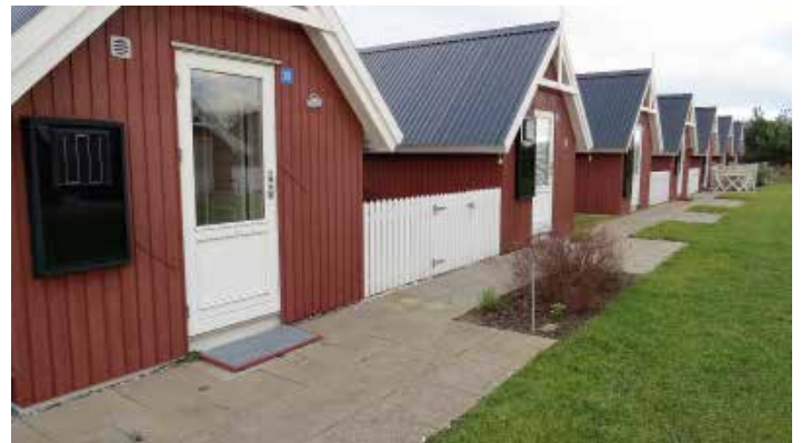
Tanker om flere huse

Skal man gå i dialog med campingpladsen om brug af deres svømmehal.