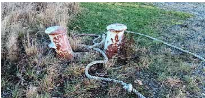
Denne "slendrian" havde ikke gåwet i Auderød

Jeg selv var "Ombord" i 1962, og uagtet at jeg var taget til at være i "hullet" som maskinmand, - så skulle jeg ligesom alle andre lære hvordan man bruger en kasteline, hilser på vagten, stiller op til mønstring på dækket, behandler "Klar ved flag og gøs" og meget mere. Alt dette foregik ret "levende" og uden risiko for at blive "Havgal"!