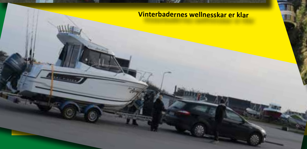
Så skal vi i vandet...