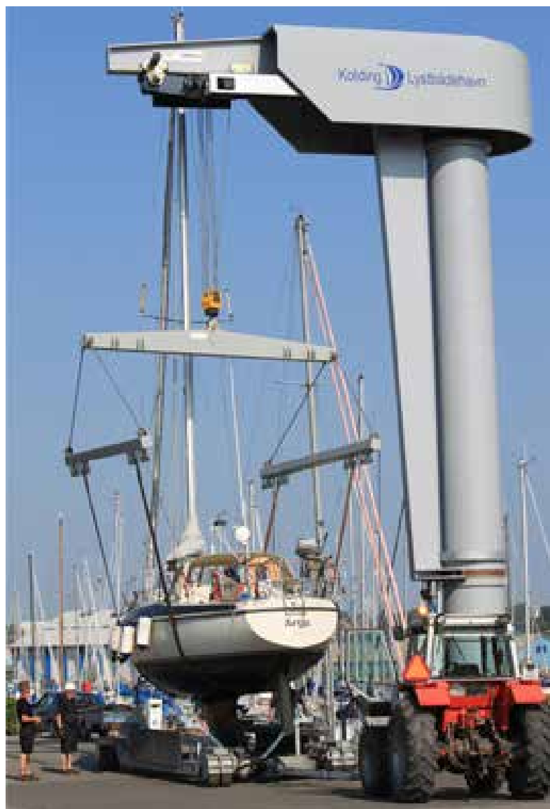
Kolding Havn løfter med kran

”Opråb, vi er blevet bedt om at undersøge hvor stor interesse der er for sejlbåde om at komme på land med mast. Det kræver et nyt løfte åg til en ca. pris på 100.000 kr. som