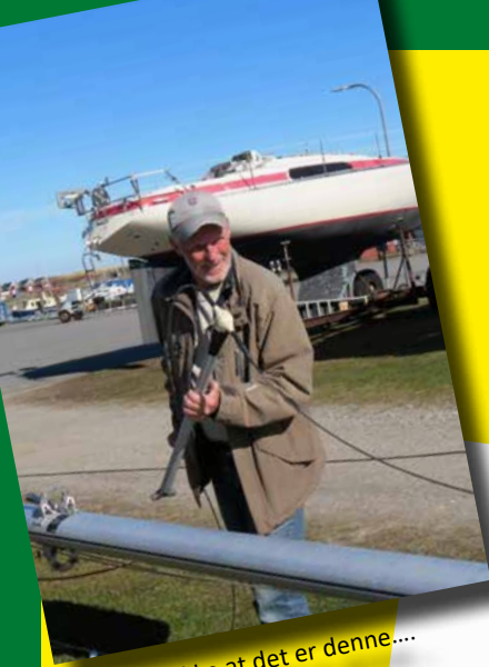
Mon ikke at det er denne....

Der blev "rykket" allerede i marts og april i det gode vejr, hvor nogle allerede er kommet i vandet!