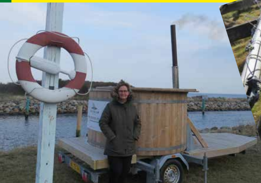
Vinterbadernes wellnesskar er klar