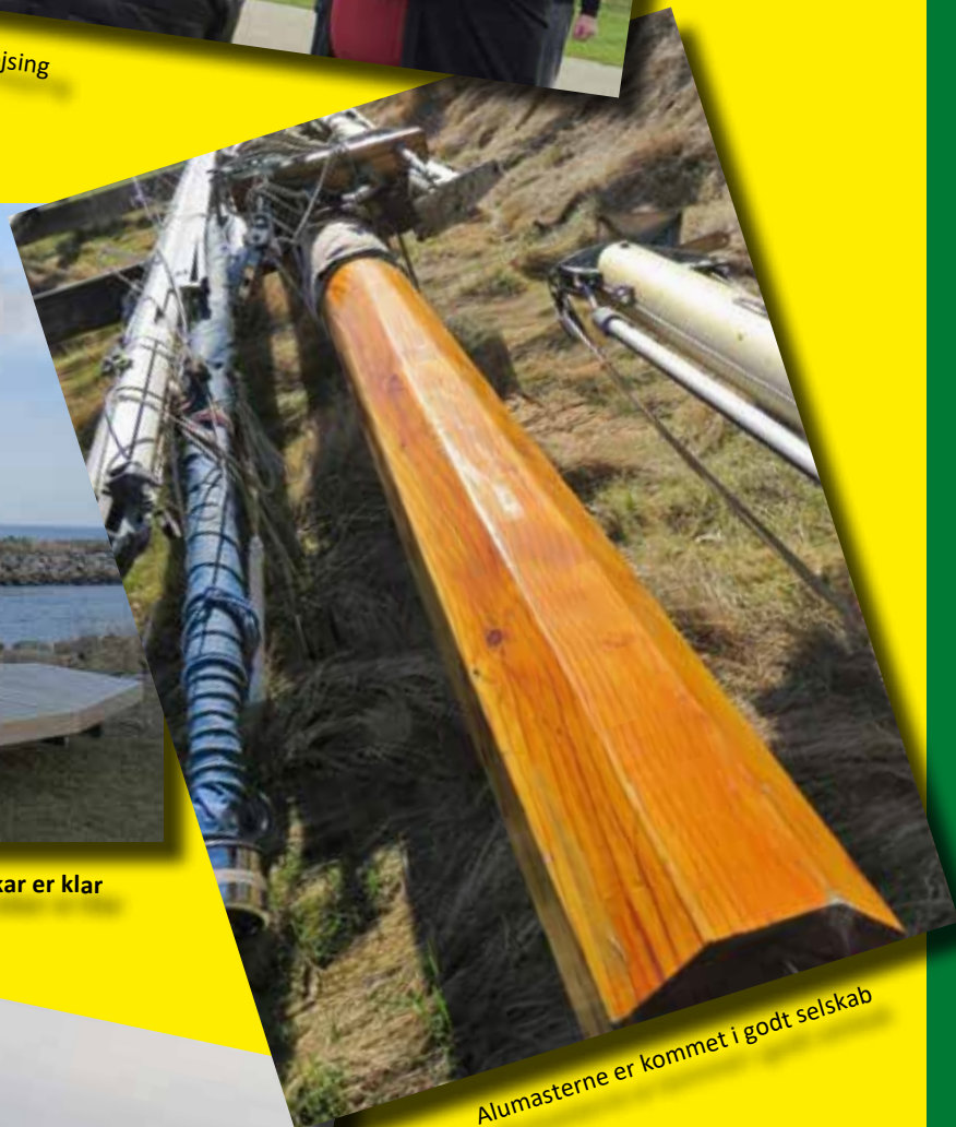
Alumasterne er kommet i godt selskab