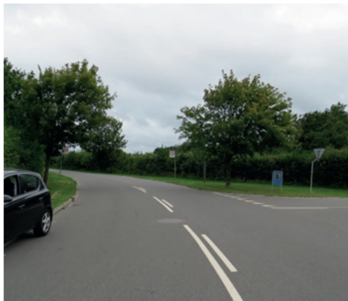
Her forbindes den med den NY cykelsti v. Apholmvej