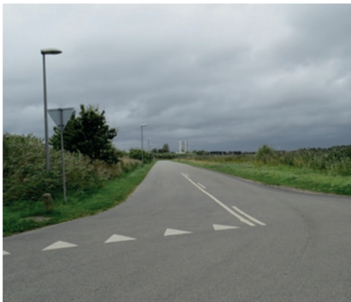
Cykelstien vil gå fra Ndr.Strandvej mod vest

Det er Center for Park og Vejs vurdering at en forbindelse ind mod byen, Rønnerhavnen og Palmestranden med fordel fortsat bør ske via Sindallundstien, som er den langsgående forbindelse for de "bløde" trafikanter fra nord mod syd. Men en god plan med fornyelse med en cykelsti mod øst, fra Sindallundvej og forbi campingpladsen ved vejsvinget og til den slutter ved den store parkeringsplads v. Ndr. Strandvej og Nordre Badestrand.